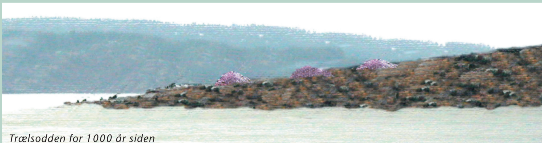
Trælsodden for 1000 år siden

Jernalderens mennesker gravla sine døde på gravfelt ved gården der de bodde. Ættefølelsen var sterk, og derfor ble graven lagt slik at det var øyekontakt mellom gård og gravplass. Det vanligste gravminnet er den runde gravhaugen eller gravrøysa. Andre gravminner er runde steinsettinger (i eldre tider trodde man at de en gang hadde vært tingsteder), steinlegginger og bautasteiner. Det finnes også graver som er skjult i bakken uten synlig markering. Noen av de døde ble brent, mens andre ble gravlagt ubrent.