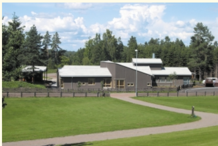
Tuften barnehage i Arne Garborgs vei er den siste barnehagen i barnehagefamilien i Stokke kommune.