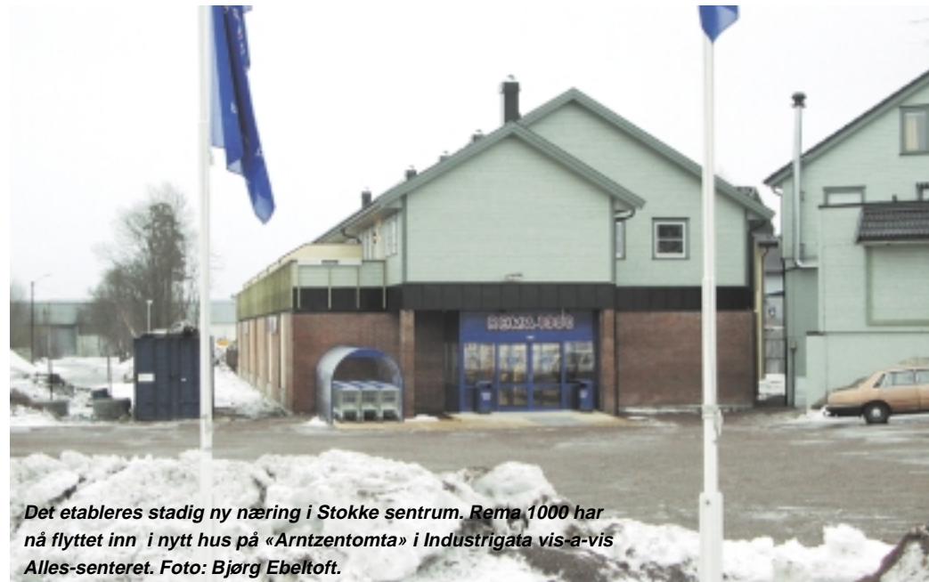
Det etableres stadig ny næring i Stokke sentrum. Rema 1000 har nå flyttet inn i nytt hus på «Arntzentomta» i Industrigata vis-a-vis Alles-senteret.