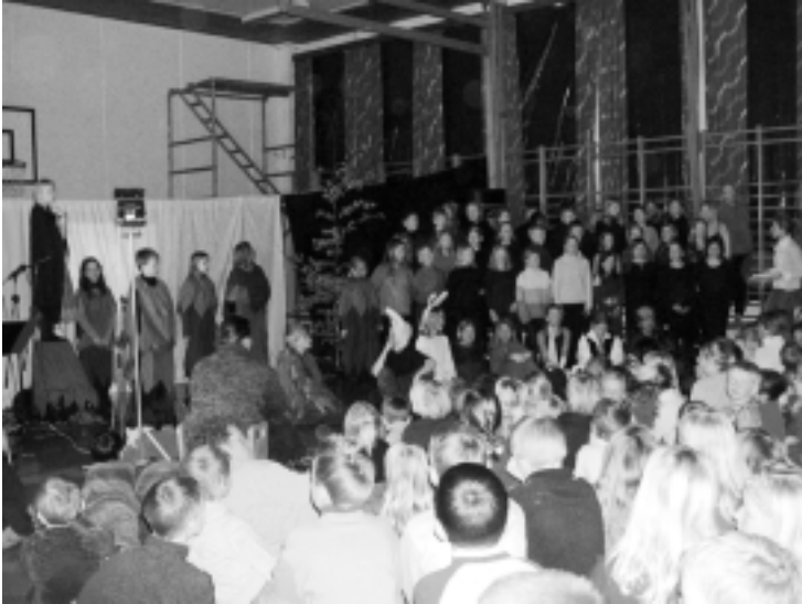
Forestilling på Bokemoa skole

vets begynnelse. Ca 70 andre elever danser, maler og spiller teater på Bokemoa skole og på Fossnes hver uke. Ca 170 små 4-5-åringer får ukentlig musikk / sanglek - timer med kulturskolens lærer i barne-hagetiden. Vi samarbeider med skolene i 5. og 9. klasse som et ledd i å utvikle «En kulturell skolesekk i Stokke». Og så har vi samarbeid med