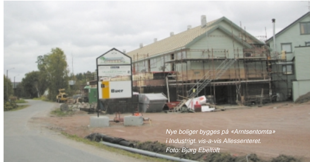
Nye boliger bygges på «Arntsentomta» i Industrigt. vis-a-vis Allessenteret.

Godkjente og igangsatte planer for blant annet Stokke sentrum, Lågerødåsen, Melsomvik, Borgeskogen, Sundland og områdene rundt Fossnes vil nok bidra til en høy byggeaktivitet også i årene som kommer.